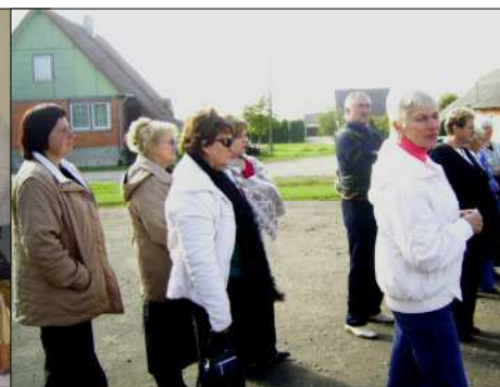
Apskritis moterų susitikimas Biržų JMB rugsėjo mėn. Apsilankymas naujame pagalbos centre